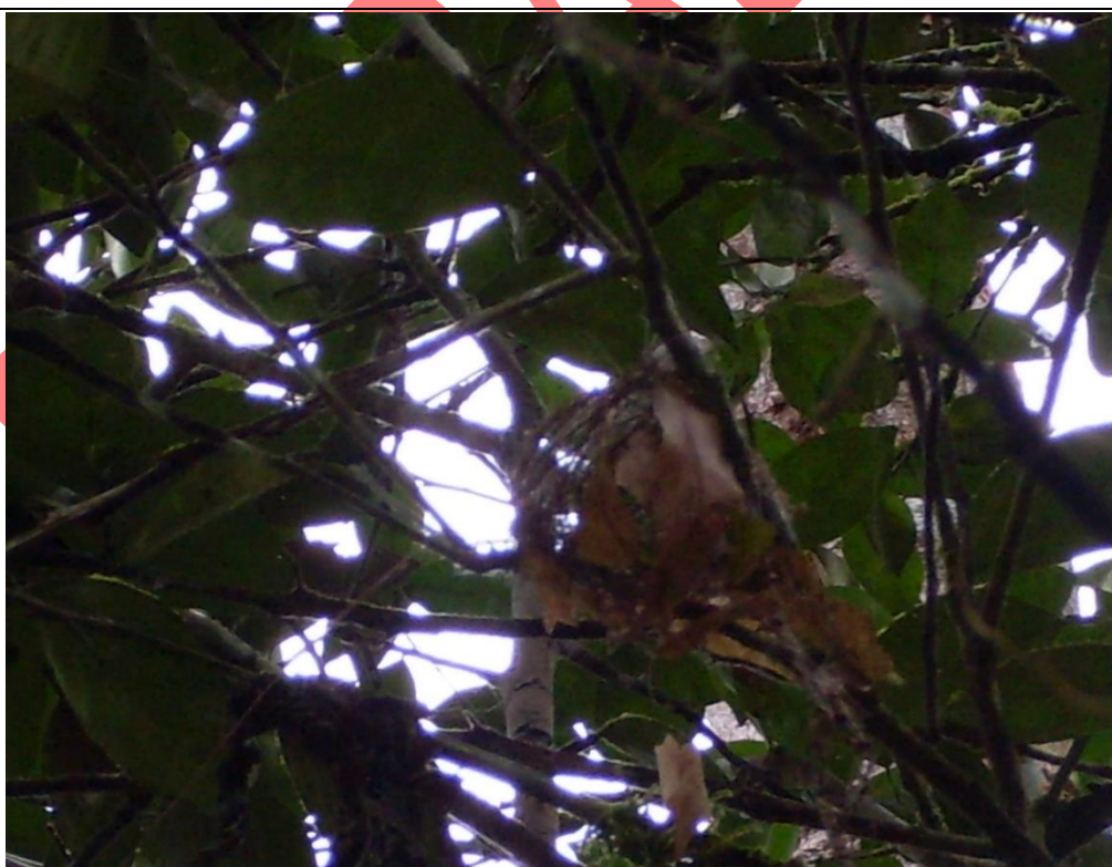
Figura 4. Nido de Ceratopipra mentalis en construcción el 11 de marzo de 2009, en la Reserva El Quebracho.