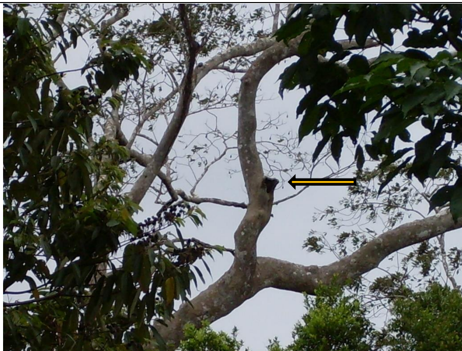
Figura 5. Nido de Tityra semifasciata en cavidad natural, 12 de marzo de 2009, en la Reserva El Quebracho.