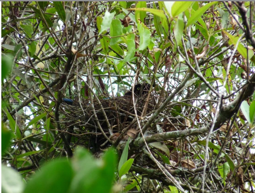
Figura 7. Nido de Cyanocorax melanocyaneus , 31 de mayo de 2012, en Selva Negra, Matagalpa.