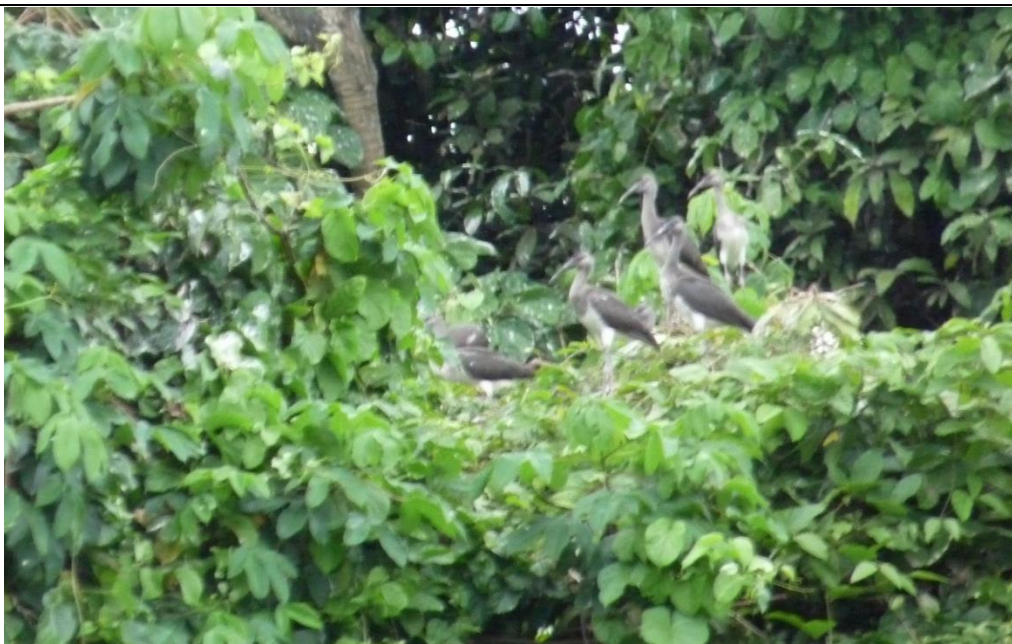
Figura 3. Juveniles de Eudocimus albus encontrados el 04 de setiembre de 2009 en la orilla de Isla Mancarroncito.