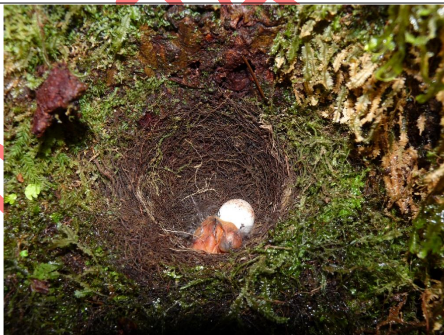
Figura 10. Nido de Catharus fuscater , 02 de junio de 2012 en Selva Negra, Matagalpa.