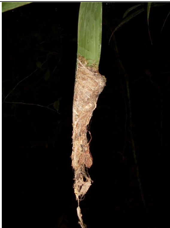
Figura 1. Nido de Phaetornis longirostris encontrado el 13 de marzo de 2009 en la Reserva El Quebracho.