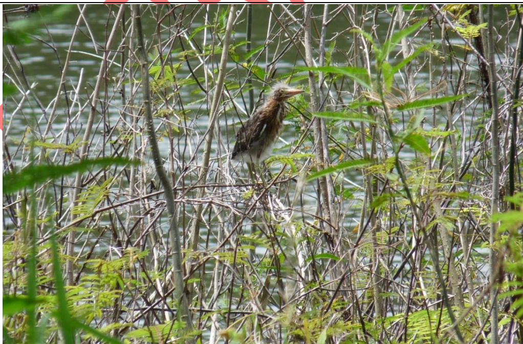
Figura 2. Juvenil de Butorides virescens encontrado el 04 de setiembre de 2009 en la playa de Isla Mancarroncito.