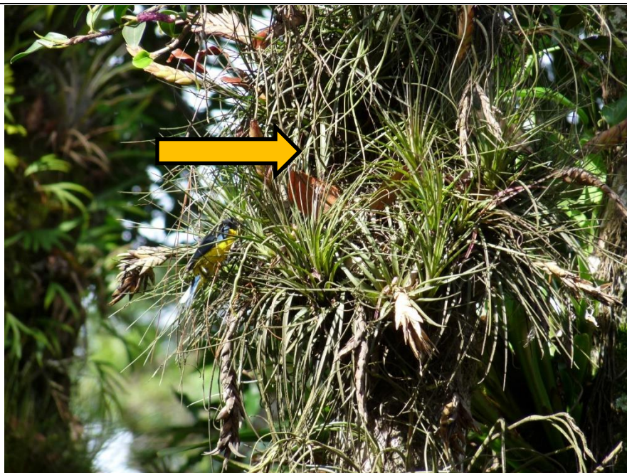
Figura 11. Nido de Euphonia hirundinacea en construcción dentro de las bromelias, el 01 de junio de 2012 en Selva Negra, Matagalpa.