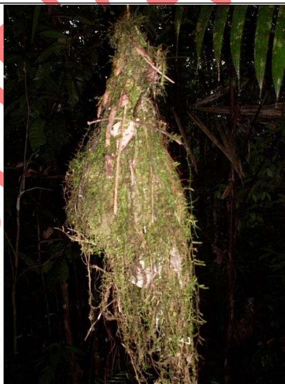
Figura 6. Nido de Mionectes oleagineus , 12 de marzo de 2009, en la Reserva El Quebracho.