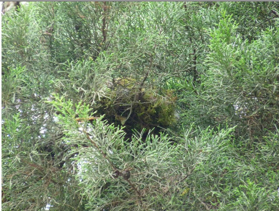
Figura 13. Nido de Ramphocelus sanguinolentus , 31 de mayo de 2012, en Selva Negra, Matagalpa.