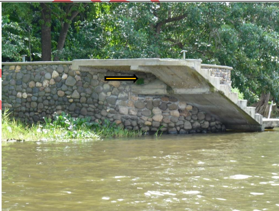
Figura 8. Nido de Tachycineta albilinea dentro de una grieta entre la estructura de concreto de las escaleras del muelle, 13 de marzo de 2009, Boca Sábalo, Río San Juan.