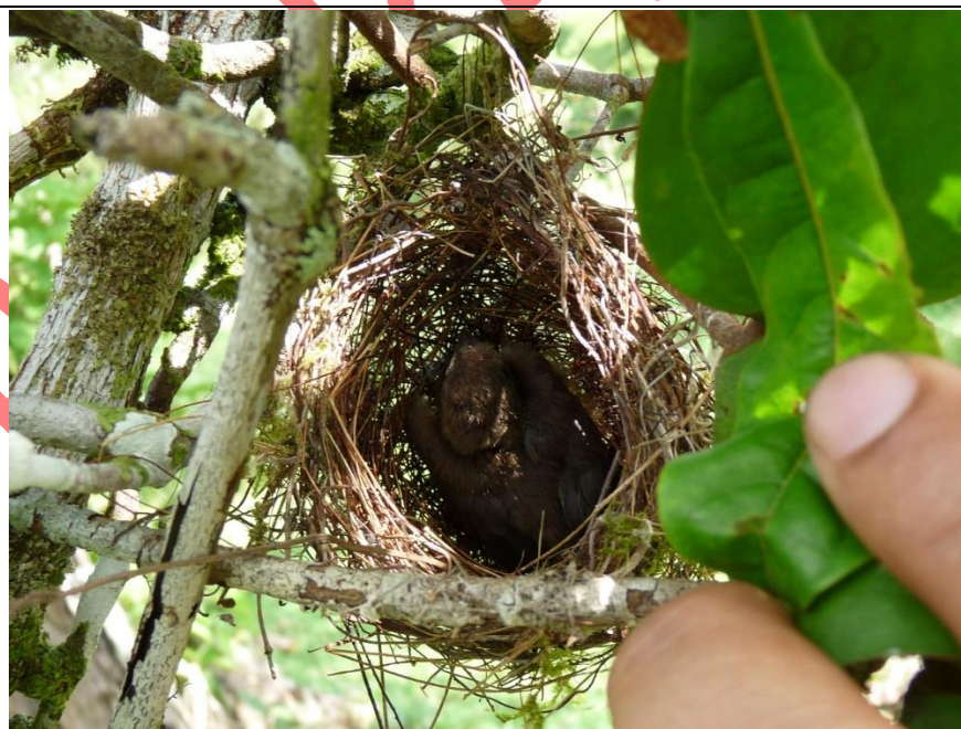
Figura 14. Nido de Sporophila corvina , 07 de setiembre de 2009, en Reserva El Quebracho, Río San Juan.