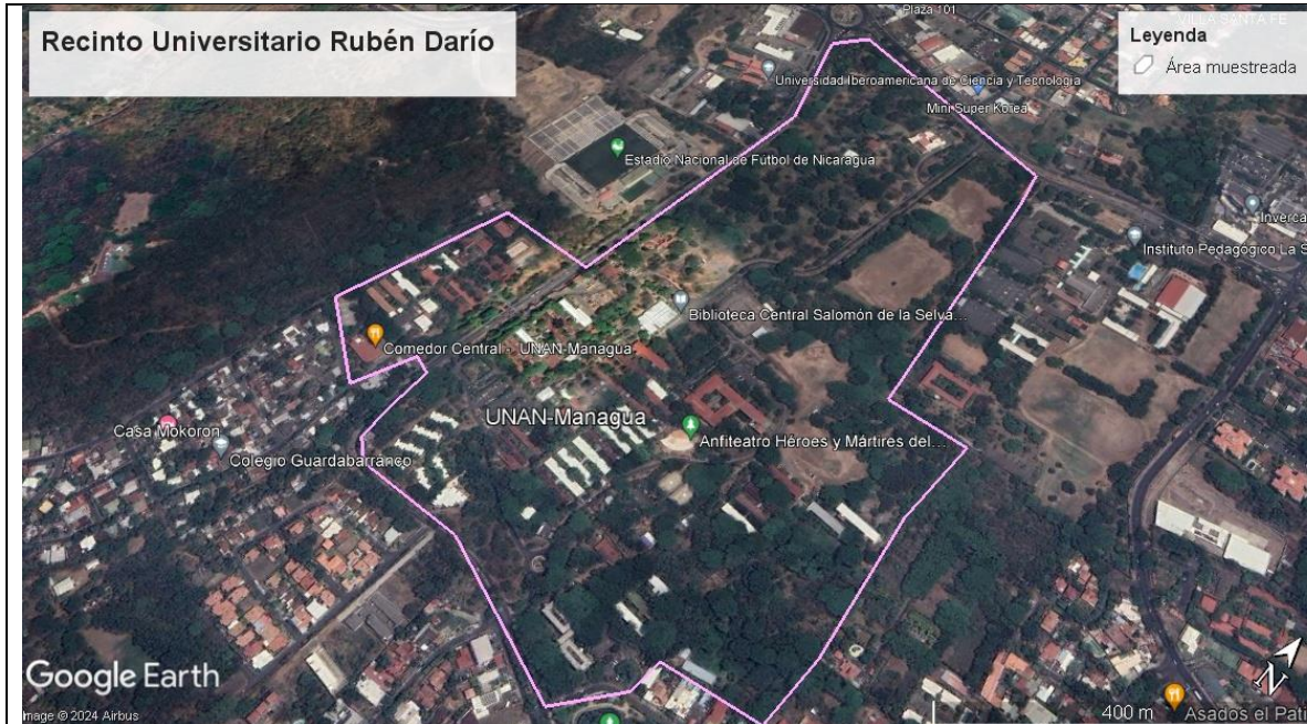
Figura 1. Recinto universitario Rubén Darío y el polígono es donde se realizó el muestreo de semillas dispersadas por murciélagos, discriminando el área boscosa (GoogleLLC, 2024).