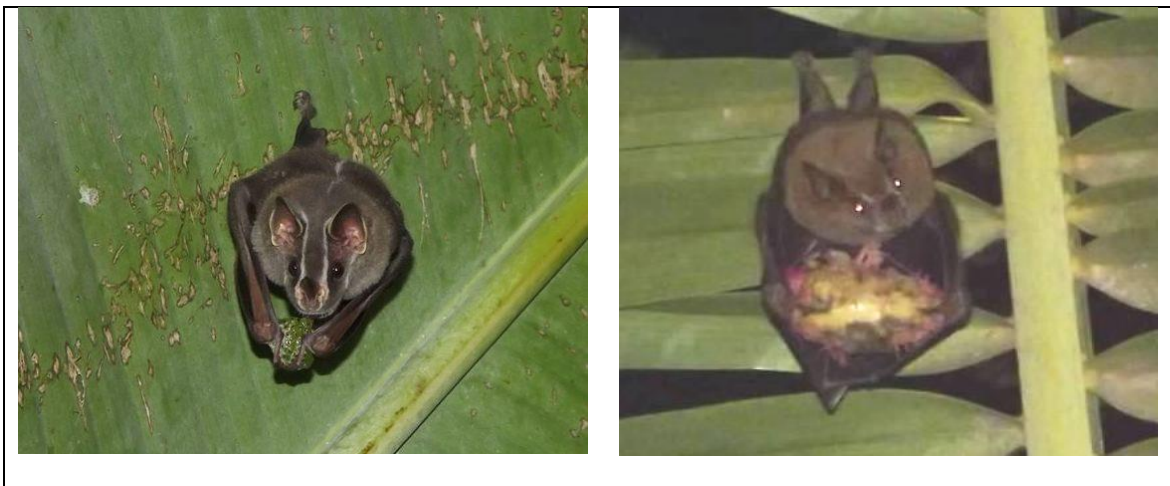
Figura 2. Murciélagos perchando y alimentándose en las áreas de muestreo: Uroderma convexum , comiendo fruto de Cecropia peltata (izquierda) y Artibeus lituratus royendo Terminalia catappa (derecha).