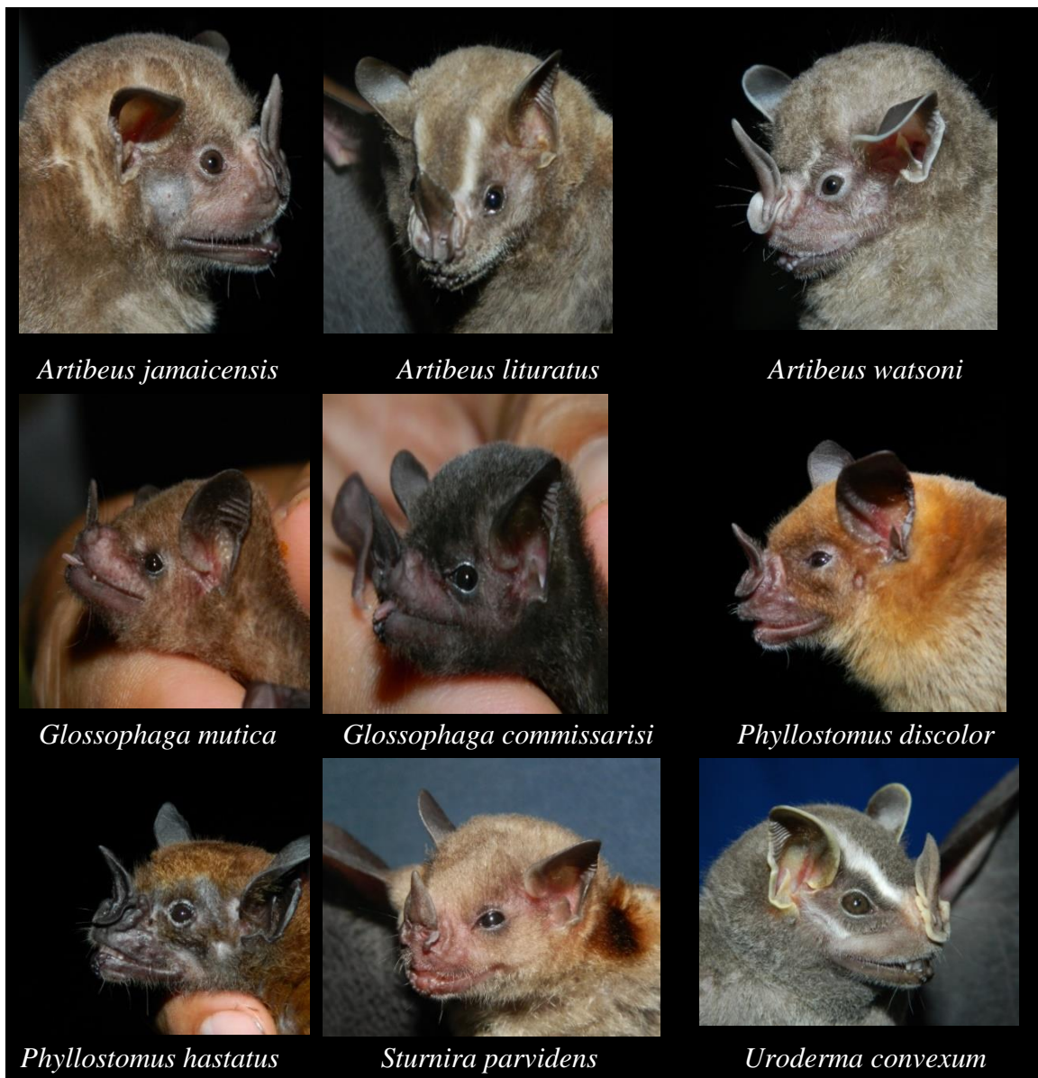
Figura 4. Murciélagos presentes en el recinto Universitario Rubén Darío.