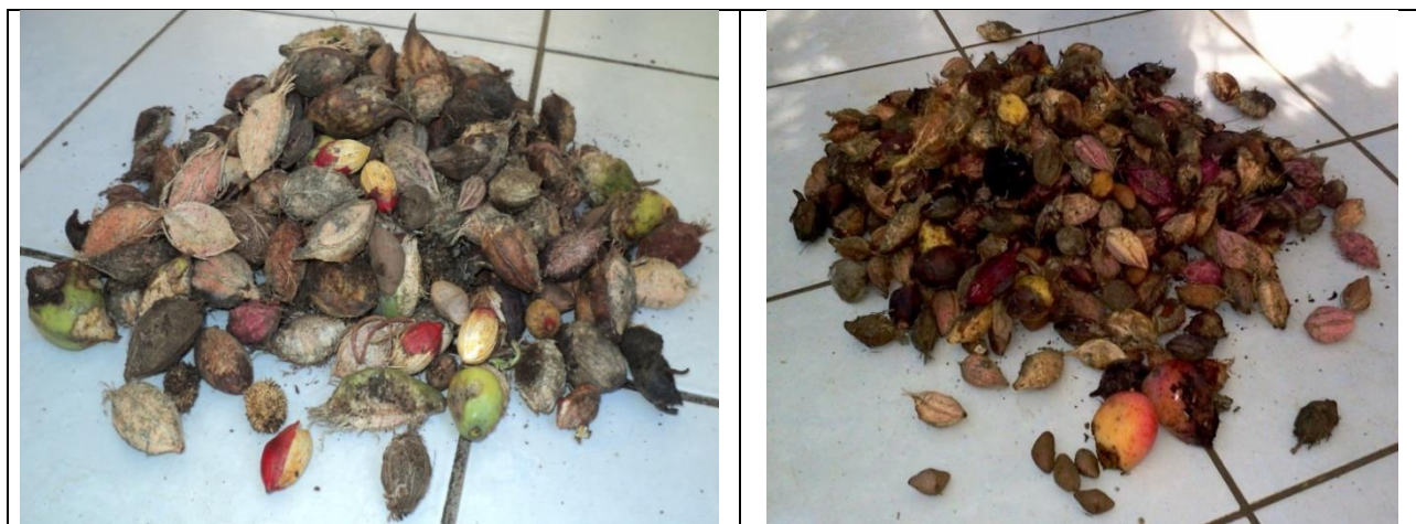
Figura 3. Muestreos realizados con aglomerados de simientes de Mangifera indica , Terminalia catappa , Veitchia merrillii y Cascabela ovata .