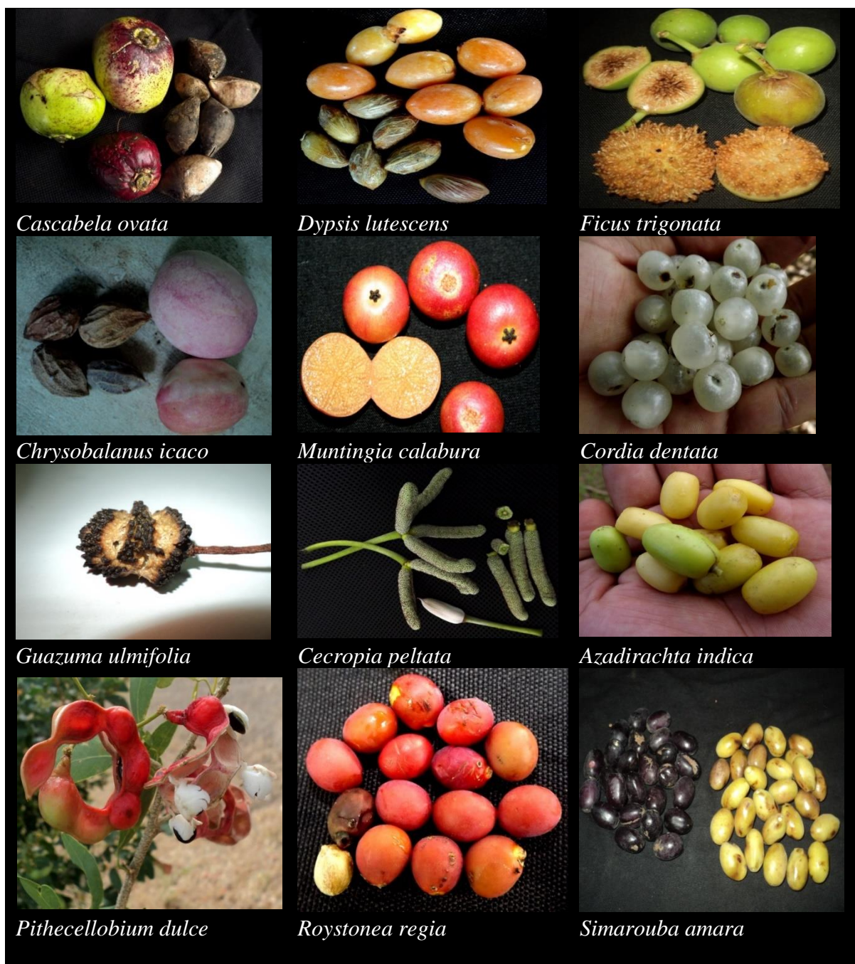
Figura 5. Algunos frutos dispersados por murciélagos en el recinto Universitario Rubén Darío UNAN-Managua.