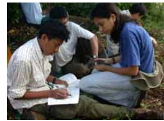
Toma de datos Durante monitoreo.

invierno, a partir de datos de captura y recaptura reunidos de estaciones múltiples en Mesoamérica adquiriendo información clave para el desarrollo de estrategias de conservación y manejo de estas especies. Las