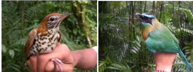
Zorzal grande ( Hylocichla mustelina )

Desde su inicio en el 2002, el programa MoSI (Monitoreo de Supervivencia Invernal) tienen como objetivo la determinación de las tasas de supervivencia y